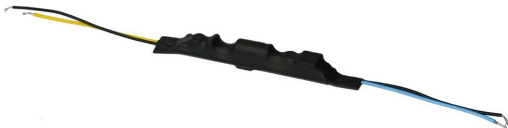
Рис.1. Внешний вид устройства АМТ-600.

Устройство АМТ-600 выполнено в виде печатной платы с компонентами, размещенной внутри полиолефиновой термоусаживающейся трубки, обжатой после изготовления. Печатная плата покрыта слоем полиуретанового лака для защиты от воздействий влаги и пыли. Из трубки выведены проводники, через которые на устройство подается входное напряжение и которыми устройство подключается к защищаемому прибору (приборам).